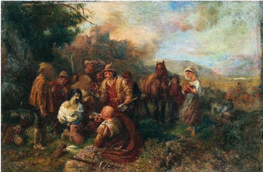
Salvator Rosa catturato dai briganti, olio su tela, cm. 65 x 98, Sulmona, collezione privata.